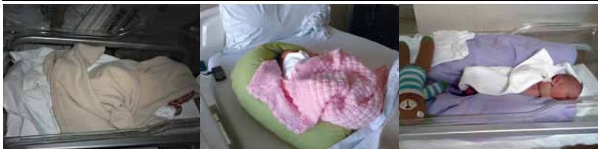
FIGURA 4. Segundo día. Sueño inseguro

La muerte súbita no se produce por la aspiración de un vómito. Se debe a la falla en el mecanismo del despertar ante la hipoxia; es consecuencia de una situación ambiental adversa, en una etapa de la vida, en un niño vulnerable. 9