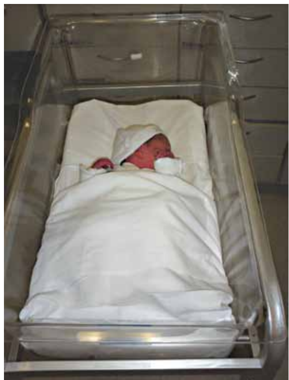
FIGURA 3. Primer día. Etapa de descanso

Las etapas son cortas, cambiantes y a veces desconcertantes si no las comprende. Las primeras horas corresponden al período de alerta, adecuadas para el contacto piel a piel y el inicio de la lactancia materna.