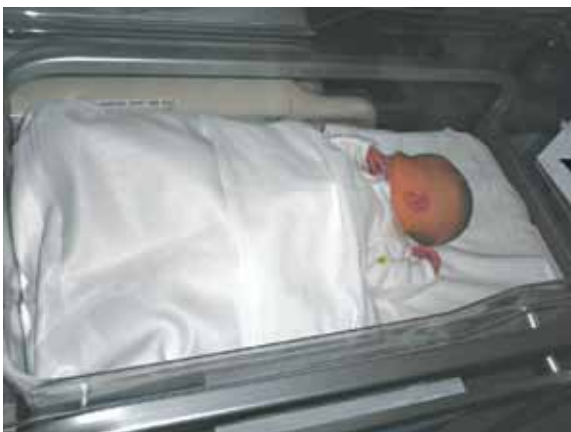
FIGURA 5. Lactancia establecida. Sueño protegido

Resta, como inquietud, determinar quién supervisa la publicidad, fabricación y venta de objetos que pueden atentar contra la salud de los niños. Por ahora, el puesto parece vacante y, mientras continúe así, somos los profesionales de la salud quienes debemos asumir un rol activo en la comunidad, sea a través del ejercicio diario de la profesión o de nuestras instituciones. ■