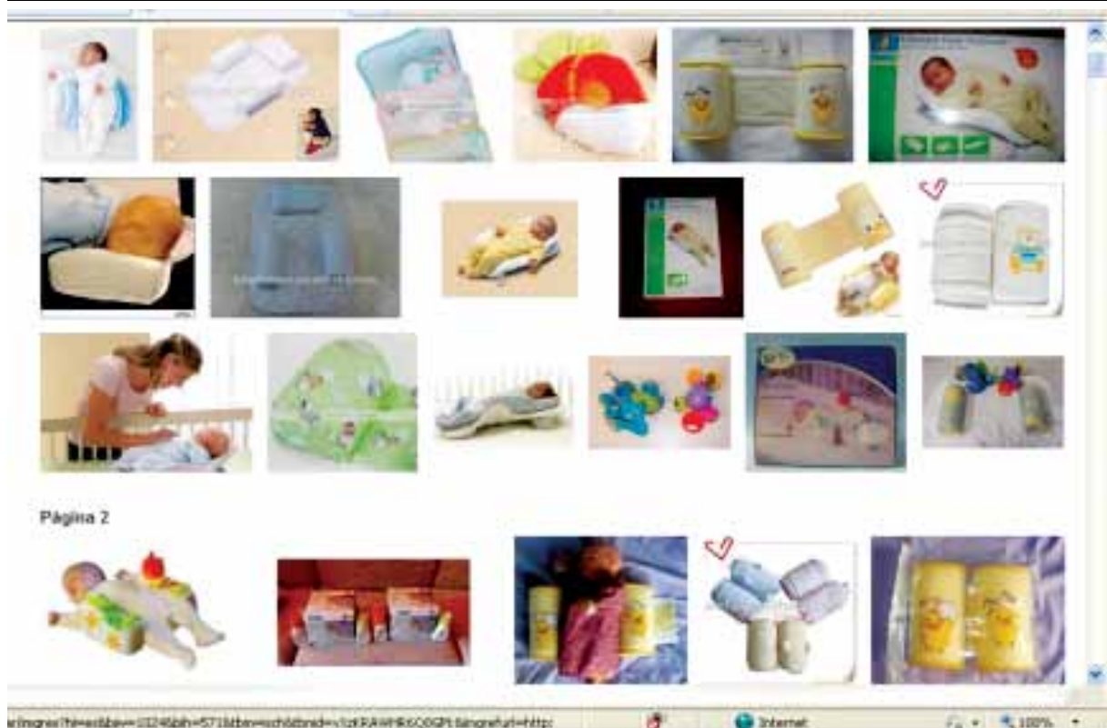
FIGURA 1. Captura de pantalla sobre búsqueda de imágenes: "posicionador para dormir bebé"

En 2008 se efectuó en EE.UU. un estudio sobre 20 revistas dirigidas al público femenino de entre 20 y 40 años de edad, con más de 5 millones de lectores, y una tirada superior a los 900 000 ejemplares, y 8 revistas dirigidas a futuros padres o padres de niños pequeños. Se analizaron 122 imágenes con niños durmiendo y 99 imágenes del medio ambiente donde duerme el niño, en relación a posición, colecho, objetos en la cuna