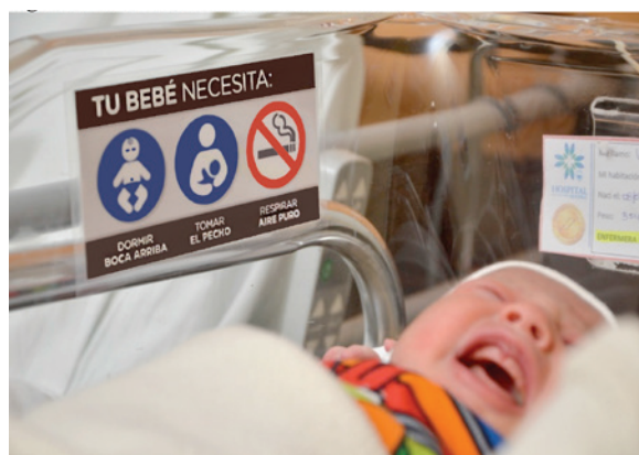
FIGURA 2. Material adhesivo en cada cuna

Asumiendo un aumento del 15% en la posición supina al dormir y basándonos en el 21% a los 4 meses de nacido previamente publicado, 7 se estimó que el incluir a 196 pacientes en cada grupo (control e intervención) permitiría detectar una diferencia de 10% o más entre ambos grupos con potencia de 80% y significancia del 5%.