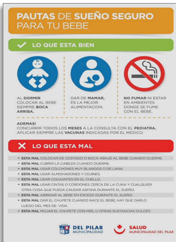
FIGURA 1. Póster de sueño seguro y material impreso

Para que el proceso de formación de los profesionales encargados de transmitir la información a las familias resultara homogéneo, se realizó, inicialmente, el mismo entrenamiento para todo el personal de salud. Este fue llevado a cabo por los médicos pediatras, autores y colaboradores del trabajo siguiendo los lineamientos de las recomendaciones sobre prevención del SMSL de la Academia Americana de Pediatría y la Sociedad Argentina de Pediatría. 7